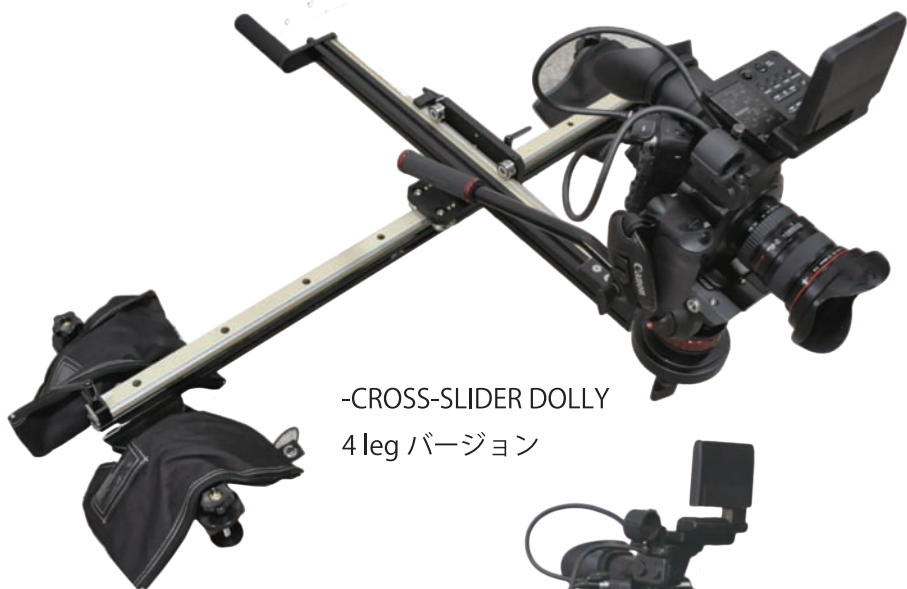
-CROSS-SLIDER DOLLY 4legバージョン