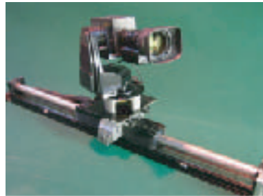
リニアレールとのジョイント