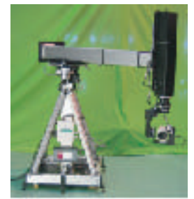
リグへのジョイント