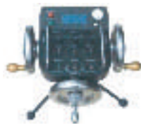
●ハンドウィール システム