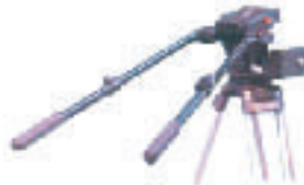
●パンバーシステム