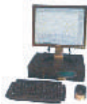
●コンピューターシステム による操作