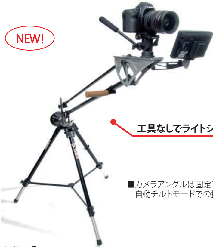
ジブアーム長 1.52m 最大カメラ搭載質量 4.5kg