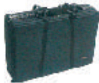
item No. Art Nr.832151