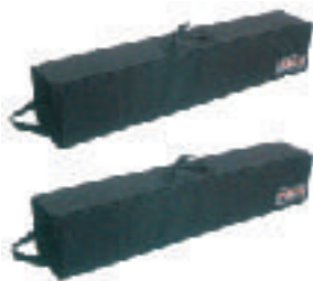
ソフトバッグ item No. Art Nr. 832150

ドイツABC PRODUCTS製のCrane120-10.5は全長が10.28mながら従来の大型クレーンよりもコンパクトで機動力があります。12×12cm角のアームは剛性が強く、かつ軽量です。セッティングの手順もシンプルなため、短時間でクレーンを組み立てることができます。アームの長さは最長で10.98m、その他9.0mバージョンが9.48m、Lバージョンが7.33m、Mバージョンが5.83m、Sバージョンが4.33mと4つのバージョンを選択することができます。カメラの最大搭載質量は20kg(9.0mバージョンは25kg、L,M,Sバージョンの場合は30kg)です。リモートヘッドCMX-RM ALEXやCMX-RM PELEをジョイントすることで滑らかな遠隔操作を可能とします。また、三脚仕様の場合はABC PRODUCTS製の三脚Bullstandを使用し、ドリー仕様の場合はMovieTech製ドリーCD5/CD6を使用します。