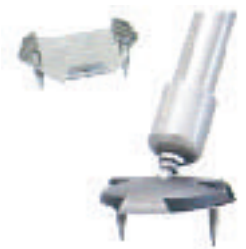
Bullstand用スパイクアダプター item No. Art Nr. 832131

※本製品の仕様及び価格は、予告なしに変更することがございますのでご了承ください。