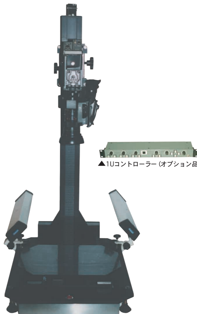
▲1Uコントローラー (オプション品)

テーブル上に設置することができ、カメラの上下移動はスプリング方式(手動)で行えます。XYステージはバリエブル方式コントローラーにより操作することができ、またXYステージをベースに内蔵させることにより、低い位置からの接写撮影を可能にしました。