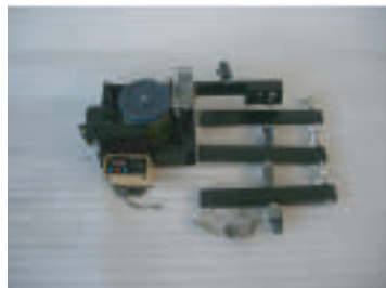
その他セット内容