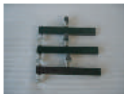
アーム3本取り付けるだけで・・・