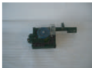
動力モーター部本体