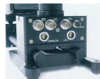
HDDV SDI ビデオ出力端子