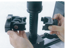
取付け簡単な モニターブラケット

※本製品の仕様及び価格は、予告なしに変更することがございますのでご了承ください。