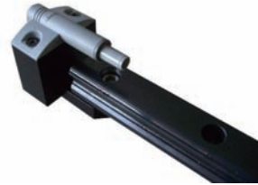
Image3: Stopper damper