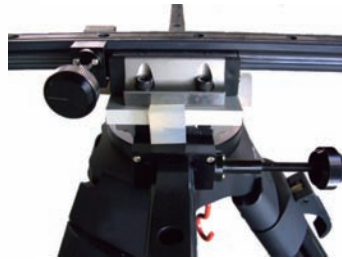
図1：X軸、Y軸ストッパー