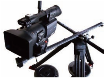
図4：カメラ搭載の様子

CINEMAX社製XY SLIDER[KATANA] 85X64Y Light5バージョンは従来のXY SLIDERと比べ、よりコンパクトです。今までより更に軽やかなスライドが可能になり、更に狭い場所の移動撮影もできます。動きは非常に滑らかな上、セッティングも簡単です。自重は本体のみで8 Kg、最大搭載質量は5 kgです。セッティングは三脚一本で使用可能な「三脚バージョン」と、スライドレグを使用した「デスクボードバージョン」の2つのタイプで使用することができます。(オプションによりローアングルバージョンも可能。) レールは低温黒色クロム処理を施しており錆びに非常に強いレールです。また、奥行き感のある動きの撮影が可能なので 3D撮影には欠かせない特機 です。