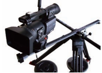
Image4: Equipped with camera

CINEMAX multi-angle camera slider XY SLIDER "KATANA" 85X64Y Light 5 is compacter than a past slider. A light slide become possible, and, in addition, the travel shot in the small place can be done. This camera slider also promises not only a very smooth movement, but also a very easy setup. The main body of the model 85X64Y Light 5 weights about 8Kg, and the maximum camera load capacity is about 5kg. As for the setup, the following 2 variations are possible: