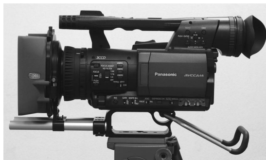
写真3 オプションのMBS-100レールサポートシステムType G 4で装着した場合

回転式トレーに4×4インチのフィルターフレームが1枚装着できるほか、レンズ前面に4×4インチの固定式フィルタートレーが装備されている(写真4、5)。回転式トレーに装着したフィルターフレームは自在に回転可能なので、ハーフフィルターやクロスフィルター等々による演出も簡単にできる。もちろん固定式と回転式を同時に使用できるので、多彩なフィルターワークが可能である。