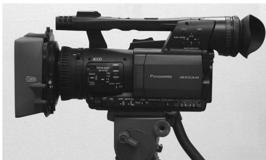
写真2 AG-HMC155にクリップオンで取り付け

MB-210は、レンズに直接取り付けるクリップオンでの装着、レールサポートシステムを使用した装着、どちらにも対応している(写真2、3)。マットボックス本体は全面無光沢の特殊塗装が施され、フィルターフレーム装着時で240gとかなり軽量なので、クリップオンでもまったく問題ないが、ガラス製フィルターを使うときなど、場合によってはサポートシステムを使用したほうがいだろう。