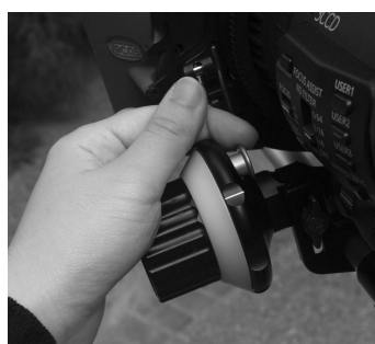
写真10 MFC-1にはフォーカスリングの動く範囲を設定できるロックノブが搭載されている。ノブを引っ張り、ポジションインディケータに合わせて回転させ好みのポジションにセットする

グの動く範囲を設定できるロックノブ機能が搭載されており、180°/350°フリー回転の3パターンで切り替えが可能となっている(写真10)。フレキシブルに設定できればベストだが、無限回転するフォーカスリングなどには有効な機能である。