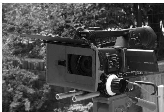
写真1 VocusマットボックスMB-210。オプションのフレンチフラッグ、MBS-100レールサポートシステムType G 4、フォローフォーカスMFC-1やドライブギア等々をすべて装着したところ