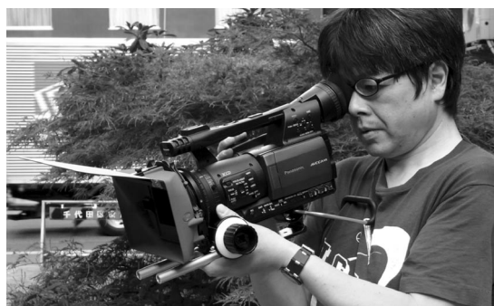
写真9 MBS-100には簡易的なショルダーサポートが備わっている