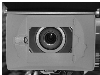
写真4、5 回転式の4×4インチフィルタートレーと、レンズ前面に固定式の4×4インチフィルタートレーが装備